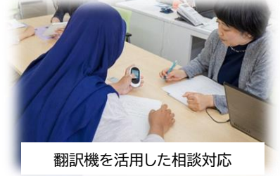
翻訳機を活用した相談対応