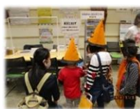
2020、2021年オーテピアで開催