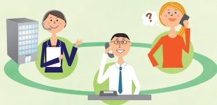
សេវាបកប្រែតាមទូរស័ព្ទត្រីភាគី

លក្ខណៈសន្យាគ្នាភ្នាក់នៅ ការងារ • ពលកម្ម ការថែទាំវេជ្ជសាស្ត្រ អាពាហ៍ពិពាហ៍ • ការលែងលះ ការបកប្រែភាសា • ការបកប្រែឯកសារ ការធានារ៉ាប់រងសង្គម • ប្រាក់សោធននិវត្តន៍ ពន្ធដារ លំនៅដ្ឋាន ប័ណ្ណបើកបរ ការសម្រាលកូន • ការចិញ្ចឹមកូន ការអប់រំ ការរៀនភាសាជប៉ុន ការការពារគ្រោះមហន្តរាយ ការផ្លាស់ប្តូរអន្តរជាតិ ជាដើម